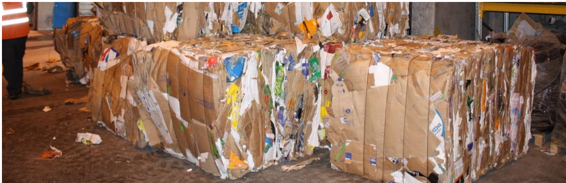
Hráefni til endurvinnslu

Samningur SOS og SORPU rennur úr gildi 31.12. 2012. Ljóst er að tíminn styttist sem við höfum til að tryggja traustan farveg fyrir þann úrgang og endurvinnanleg efni sem falla til á þessu svæði. Mikilvægt er að aðildarsveitarfélögin fylgist vel með framvindu mála og komi strax fram með skoðanir sínar og óskir. SOS og SORPA hafa gert drög að framahaldssamningi til 12 mánaða þar sem ekki er ljóst hvort samruni byggðarsamlaganna gangi eftir fyrir áramótin 2012/2013.