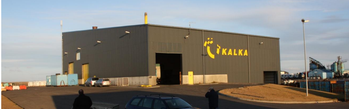
KALKA Sorpbrennslustöð, þar er meðal annars brenndur áhættuvefur.

Samráðsnefnd sorpsamlaganna á suðvesturlandi hefur samið drög að reglum um meðferð og förgun sláturúrgangs og hafa þau drög verið kynnt hagsmunaaðilum og samþykktar af hlutaðeigandi sorpsamlögum