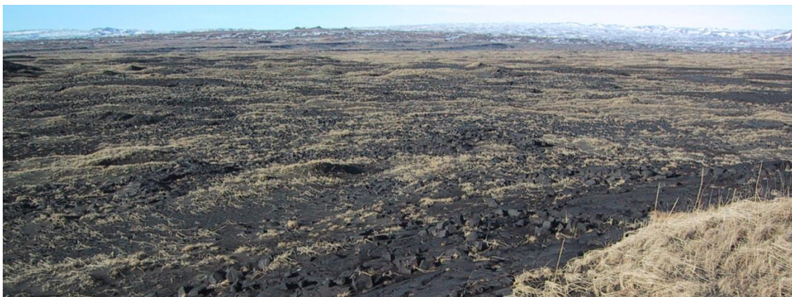
Nessandur, þar gerir Sveitarfélagi Ölfus ráð fyrir 15 ha. sorpförgunarsvæði í tillögu að breyttu aðalskipulagi 2010-2022

Í júní 2012 var hafin vinna undir samstarfsnefnd sorpsamlaganna á SV-horninu um leit af nýju urðunarsvæði, Alta leiðir þá vinnu, sveitarfélögunum hefur verið sent bréf þar sem verkefninu er lýst. Sveitarfélögin verða boðuð á fund um málið fyrir nóvemberlok 2012.