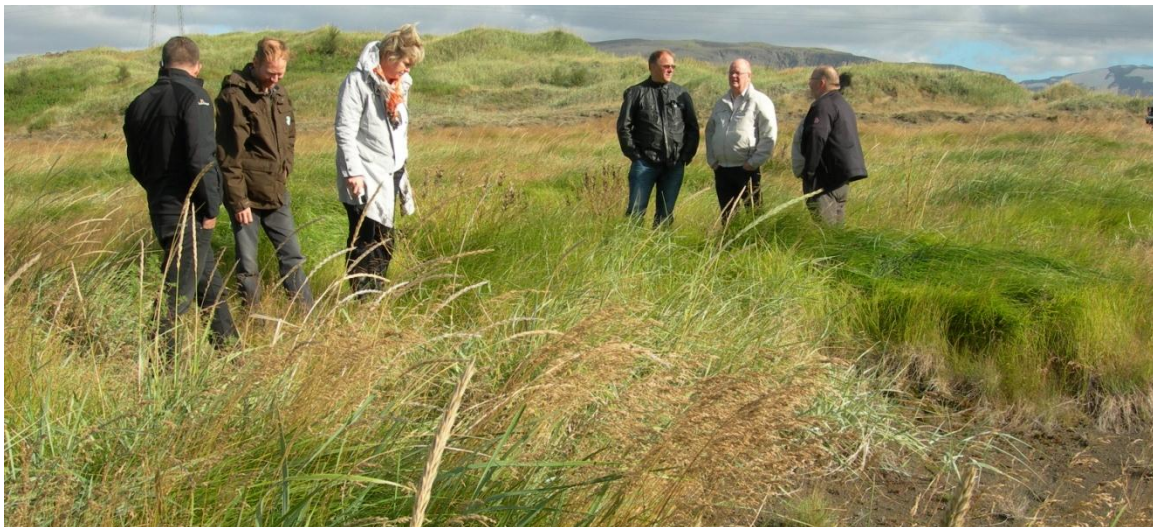
Stjórn SOS skoðar árangur landgræðslu með lífrænum áburði.